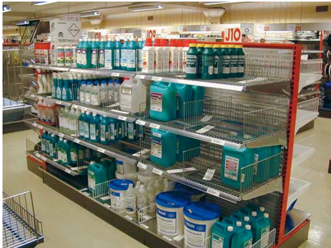
Delar av sortiment i Resmat filiallager på Muskö.

System DELTA hanterade nu 100 000 transaktioner per dag från 2 500 användare i sin stordator och egna, rikstäckande nät.