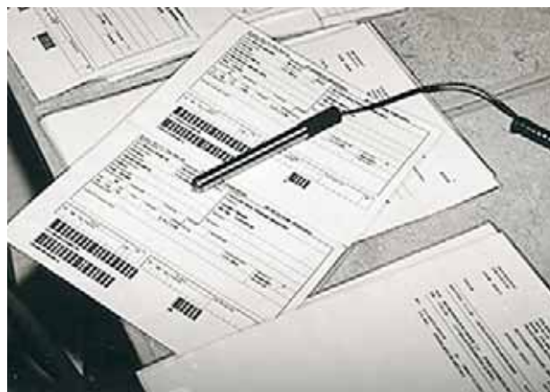
ADF- införande 1993.

I början av 90-talet moderniserades vårt bergslager och en lokal ovan jord på 10 000 kvm anskaffades för att avlösa externa lager. Strekkodshantering och handdatorer med radiokommunikation infördes och leverans inom 24 timmar utlovades.