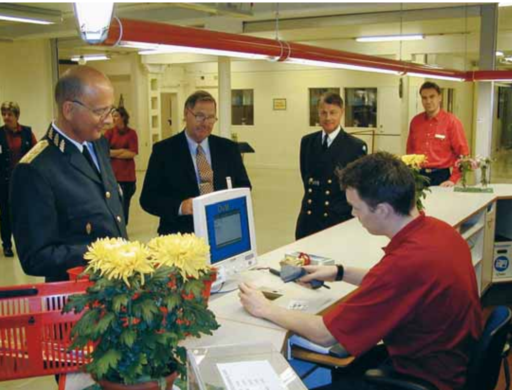
Snabbköpskassa på Muskö, styrd av DELTA.