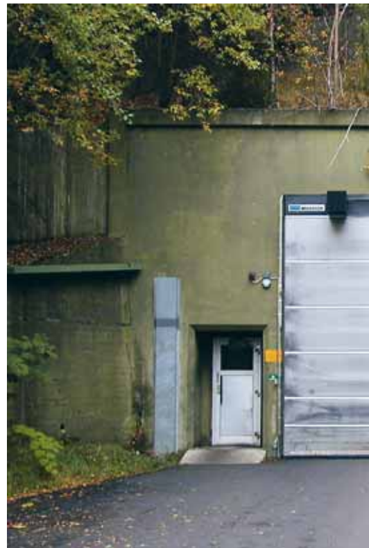
Nedgång till Sveriges säkraste snabbköp.

reservdelsorganisation, vilket mästerskap ännu innehas.