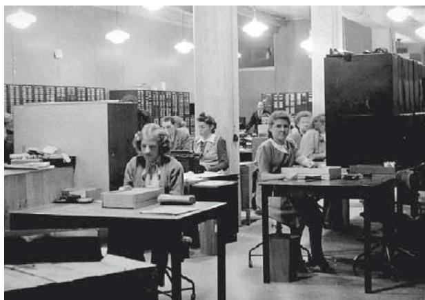
En tunnel med redovisningspersonal.

För mer information om ResmatE, kontakta kundservice 0589-407 99.