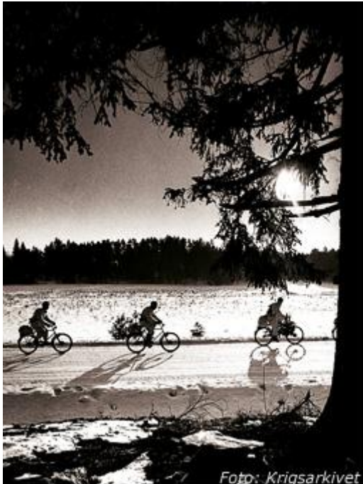
Kallt krig och vintersol i mitten på 60-talet.

På Orienteatern i Stockholm går en kritikerrosad föreställning om ett av kalla krigets svenska trauman - den DC 3:a som sköts ned den 13 juni 1952. Föreställningen heter bara DC3. Den är ordlös. Publiken förstår ändå därför att historien är levande. Inte minst därför att den åter har blivit aktuell. Marinen förbereder nu ett nytt försök att bärga planet. De anhöriga, som är i livet, har väntat i 52 år på sanningen om vad som hände.