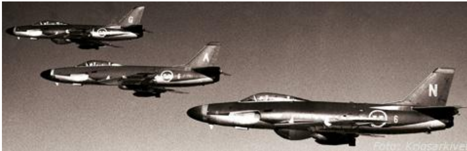
En vanlig syn över Sverige på 1960-talet - Lanserplan på väg till övning. Här ser vi lansar från F 6 i Karlsborg med bomber under vingarna.

Kustinvasionen skulle ha blivit första attackeskaderns stora stund. Det var för detta man hade övat. Många flygare och navigatörer hade fått offra med liv. Göran Tode var en av attackflygets många piloter under 1960-talet. Under 1970-talet skulle han leda anfallet mot invasionsfartygen. Det paradoxala är att slaget aldrig skulle ha kunnat äga rum. Invasionen skulle inte ha kunnat ske om inte attackflyget först hade slagits ut. Attackens styrka var att finnas till.