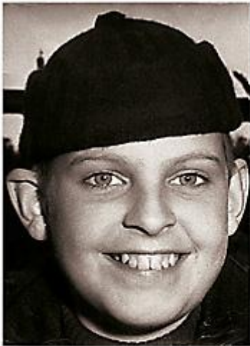
En av 132 597 46:or till synes oberörd av världens oro vid 1950-talets mitt.

Koreakriget, Ungernrevolten, Catalinan, Berlinkriserna, kärnvapenhotet. Det var den värld som miljoner svenska barn växte upp med. Efter Stalingrad kom de stora krigskullarna som skulle få växa upp i en, som deras föräldrar hoppades, fredligare värld. I stället fick vi lära oss att leva med det kalla kriget. Att det skulle sluta så hade vi inte kunnat föreställa oss och många har nog svårt att ännu fatta att det kalla kriget är över.