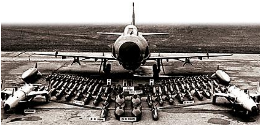
Ett lansenplan med arsenalen. Alla vapen kunde naturligtvis inte bäras samtidigt. Huvudvalen var robot 04, bomber eller raketer.

Attackeskadern fick bland det bästa Sverige kunde erbjuda - som sjömålsrobot 04.