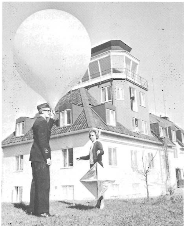
Ballongviseringar har alltid utförts på F 1. Här ses en senare typ av ballong med radarreflektor.

sationen efter en utredning 1943 och Militär Väderlektjänst (MV) i Stockholm växte till 7—8 personer 6 ).